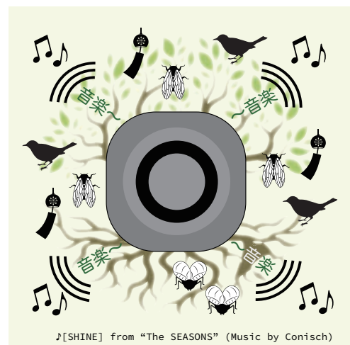
【上図】4ch スピーカーシステム再生例 『SHINE (夏)』The SEASONS 収録音源

店舗やオフィス、空港ラウンジ、病院の待合室、ヨガやアロマセラピー、介護施設、幼稚園、保育園など様々なシーンでの利用を想定しています。